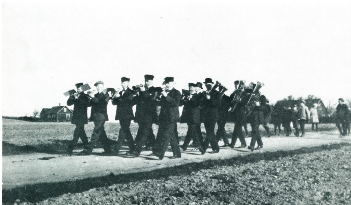
Sextetterna Göta och Svea sammanslagna vid 1:a maj-rundan någon gång i början av 1920-talet.

I musikhuset finns förutom en stor repetitionslokal, tre mindre övningsrum, ett välordnat notbibliotek samt pentry och wc. Aktiviteterna i Blåskulla är många, och praktiskt taget varje kväll i veckan pågår musikövningar med hela orkestern eller med de olika instrumentsektionerna samt elevundervisning.